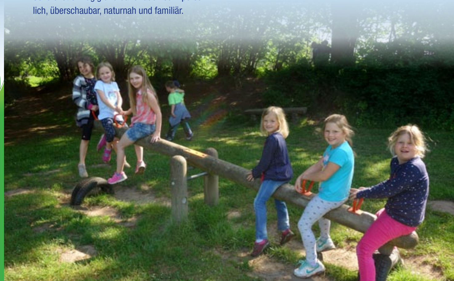
Außenstelle der Kahlhorstscheule

Unsere Schule wird momentan von 80 Schülerinnen und Schülern besucht, die aus den verschiedensten Ortsteilen und Dörfern ringsherum kommen. Unterrichtet werden sie von 5 Lehrkräften und einer Lehrerin in Ausbildung. Dazu kommt eine Sonderpädagogin, Schulbegleiter und eine Schulsozialarbeiterin.